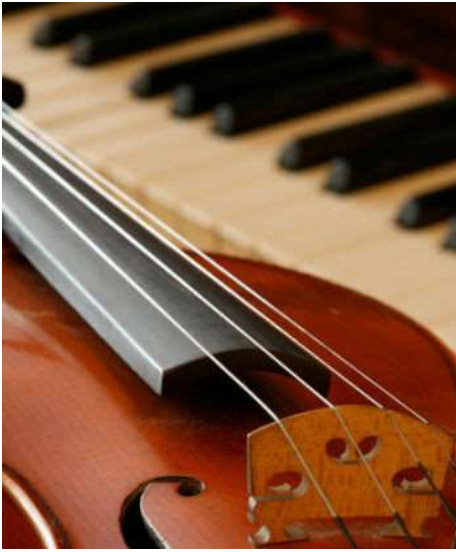
Illustrasjonsbilde / bilde til mediaside [Endre bilde]